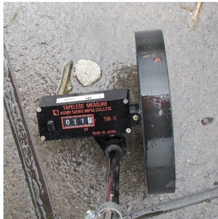
Distancia entre mástiles: 11.60 m